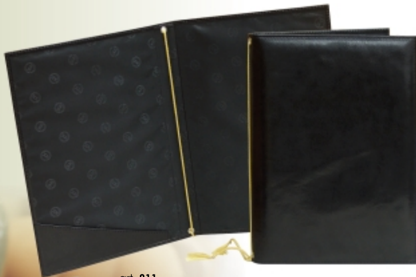
art. 811 ETUI ZA JELOVNIK

DIMENZIJE: 23,5 x 32 cm MATERIJAL: prirodna koža