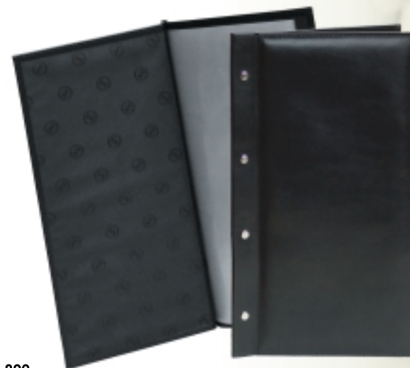
art. 800 ETUI ZA VINSKU KARTU

DIMENZIJE: 26 x 32 cm MATERIJAL: umjetna koža