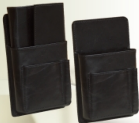
art. 358 FUTROLA ZA NOVČANIK DIMENZIJE: 11 x 18 cm MATERIJAL: prirodna koža