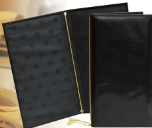
art. 812 ETUI ZA VINSKU KARTU

DIMENZIJE: 23,5 x 32 cm MATERIJAL: prirodna koža