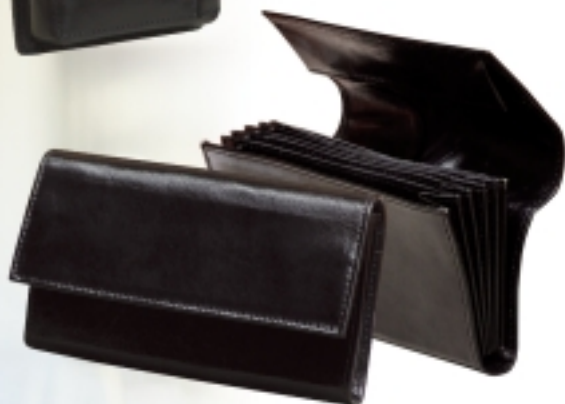
art. 359 NOVČANIK DIMENZIJE: 18 x 11 cm MATERIJAL: prirodna koža